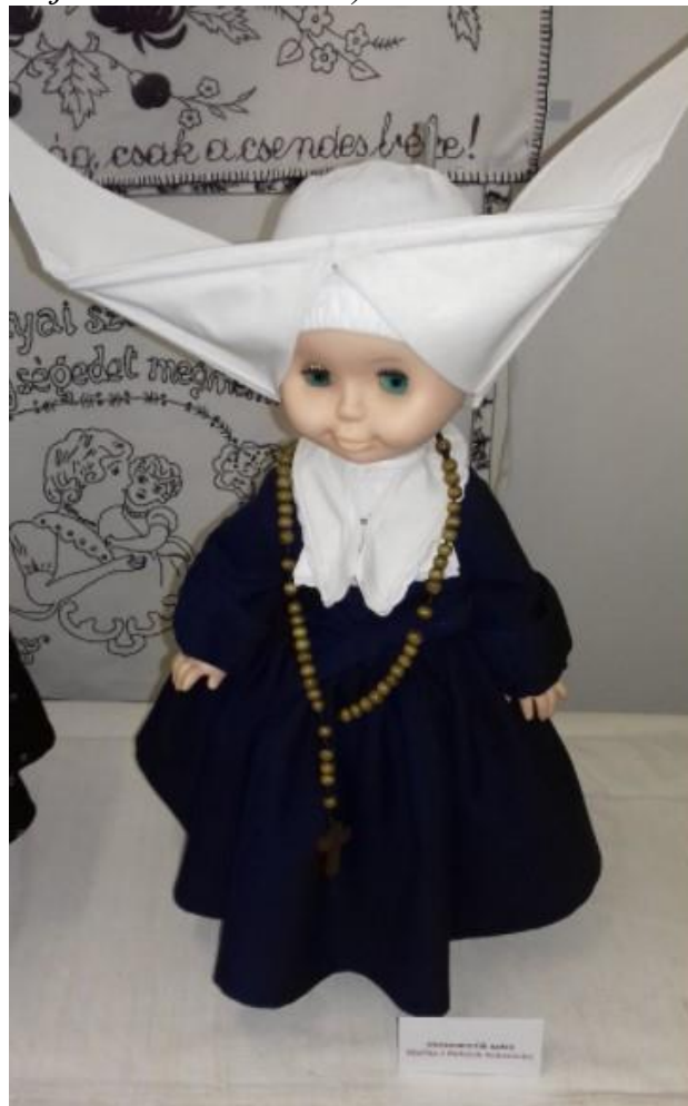
2022-ben megjelent Gazdag Katalin: Lányok, asszonyok ünneplőben könyve. A nyugdíjas pedagógusnak az elmúlt években sikerült egy olyan gyűjteményt létrehoznia, amely a 20. század első felének népviseletét mutatja be. A Vilma