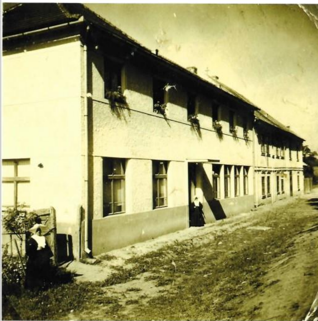
A szemerédi irgalmas nővérek a Máriaház épülete előtt (a fénykép eredetileg 5×5 cm nagyságú)