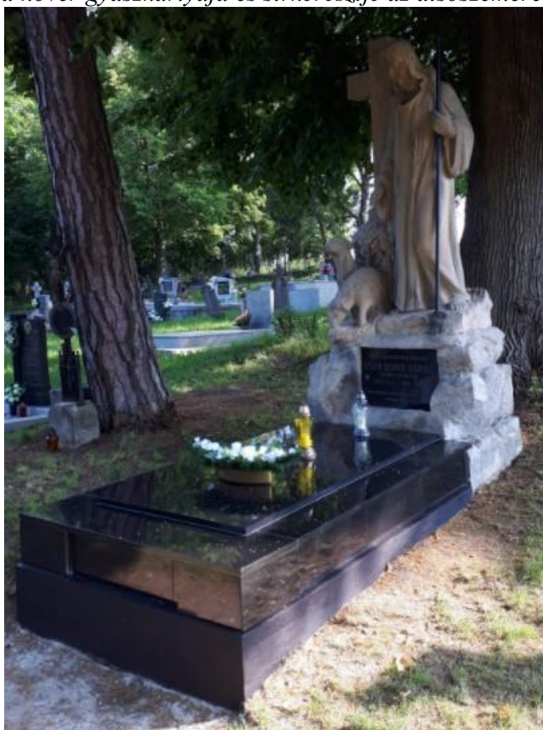
Viszolaicszky Károly esperes-plébános felújított síremléke