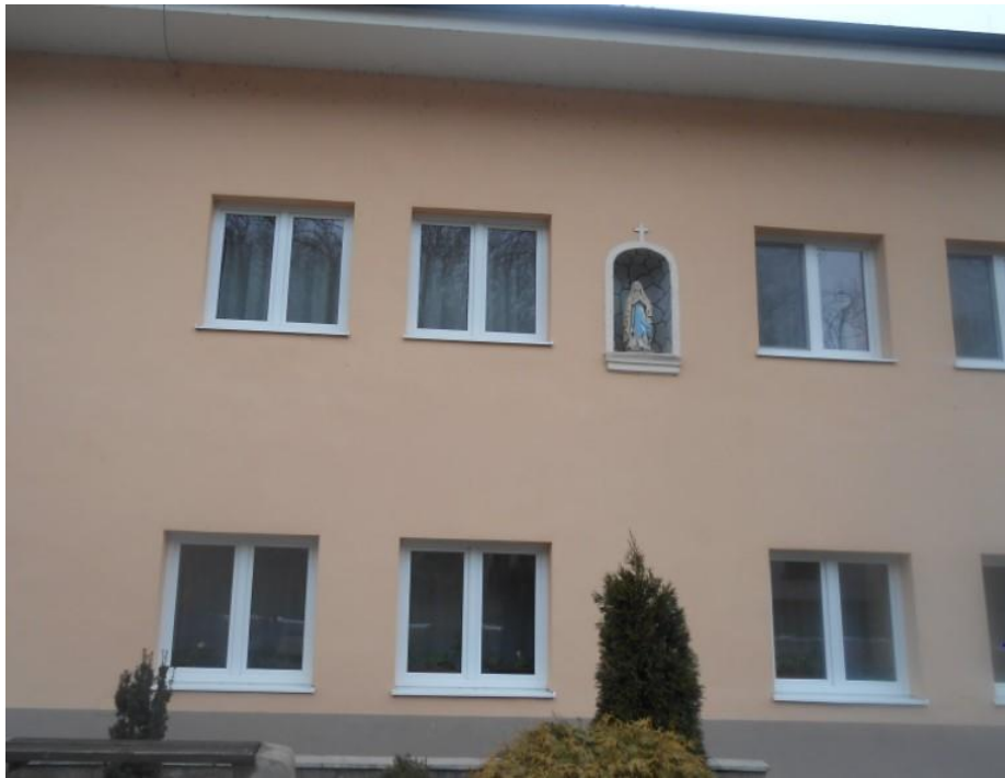
A Mária-ház jobb oldalszárnya a falfülkébe beillesztett Szűz Mária szoborral (a fotó már az épület felújítása után készült)